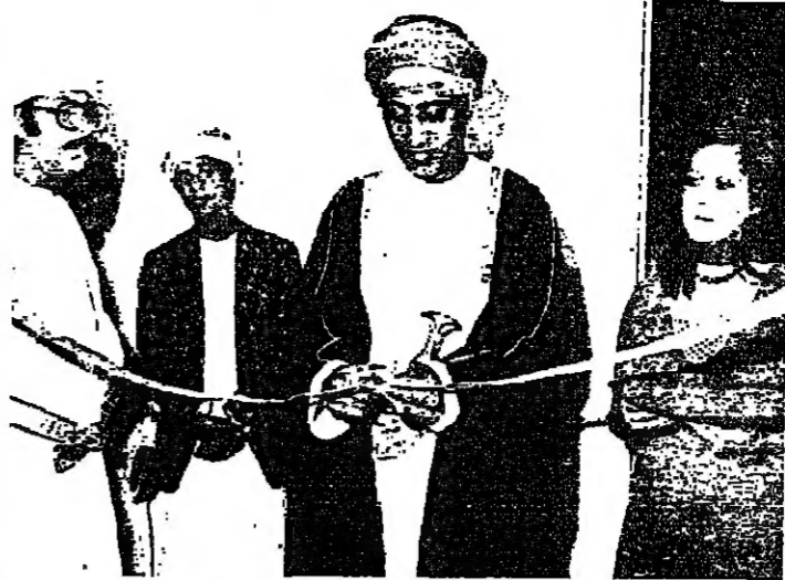
معالي وزير التجارة يقص شريط الافتتاح

احتفل تحت رعاية معالي الأستاذ محمد الزبير وزير التجارة والصناعة أمس الأول بافتتاح شركة التأمين الوطنية العمانية بمقر الشركة بمطرح الكبرى . وحضر حفل الافتتاح عدد من كبار المسؤولين والسفراء المعتمدين لدى السلطنة . ويذكر ان الحكومة العمانية تساهم في رأس مال هذه الشركة التي ستساهم في دفع عجلة الاقتصاد والتنمية في البلاد الى الامام .